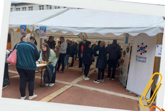
CAF - CPAM 43

Chaque atelier s'est conclu par une présentation des offres d'emploi et des conseils pour préparer leurs candidatures, offrant des perspectives concrètes et motivantes pour un avenir professionnel.