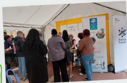
CAF - CPAM 43